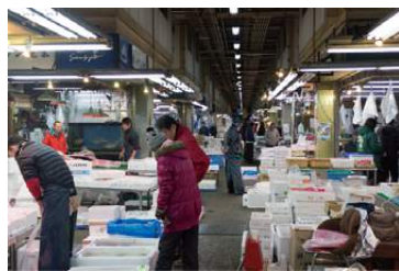
写真：京都市中央卸売市場水産棟