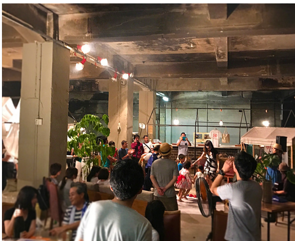
バーベキューコート