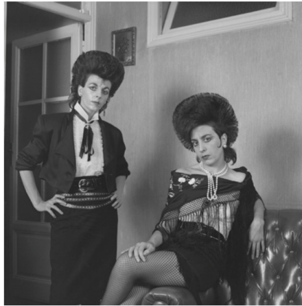
「2人の女性」1988年 © Alberto Garcia-Alix

作家名：アルベルト・ガルシア・アリックス 展覧会名：「 IRREDUCTIBLES 」 会場：三三九（旧氷工場） 入場料：600円（500円）